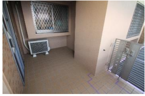
一戸建ての様な門扉を備えた アルコーブ