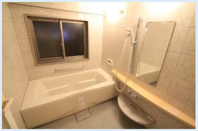
一日の疲れを癒す1620サイズの、快適広々バスルーム 大型の窓、浴室乾燥機等、充実の設備も完備。