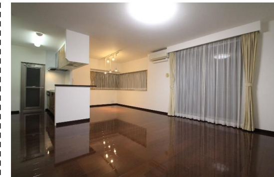
照明・カーテン・リビングエアコン付き！