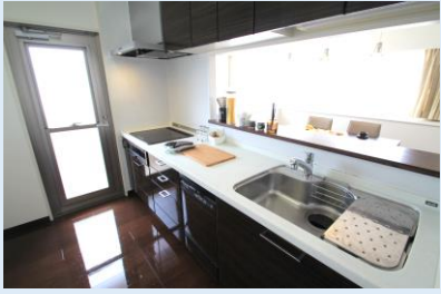
IHヒーター、食器洗浄乾燥機も備えたキッチン は人気カウンタータイプ。勝手口もあり、とても機能的です