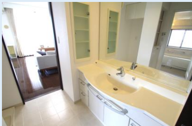
大型ミラーの洗面化粧台。キッチン/リビングからも 動ける動線は、家事をするのにとても便利です