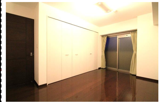
壁一面に大容量のクローゼットを備えた洋室1は約8.1帖の広さ！ プライベートバルコニーにも面しており、主寝室に最適！