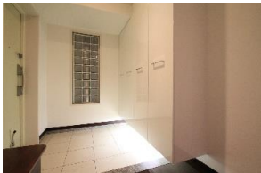
玄関には大容量の シューズボックスを設置