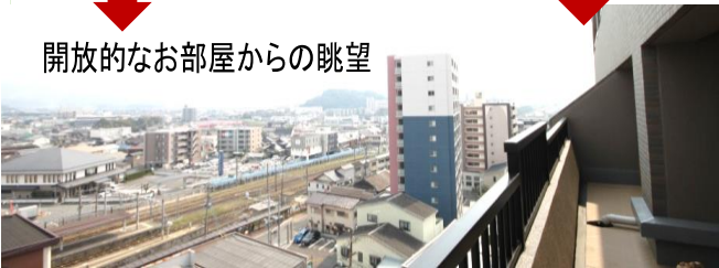
開放的なお部屋からの眺望