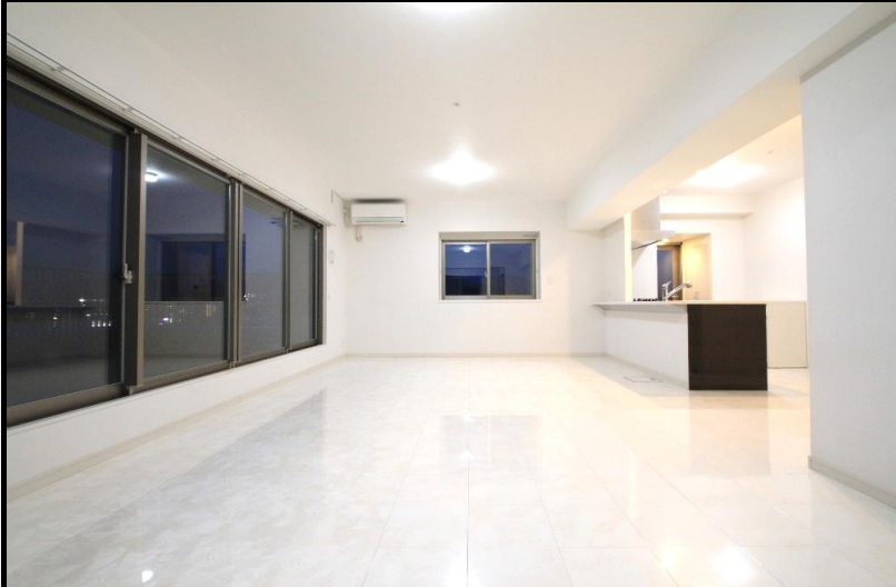
大理石調のフロアが施された豪華リビングルーム

専有面積 108 m 2 超の 4 LDK東南角部屋 ルーフバルコニー付 新登場!