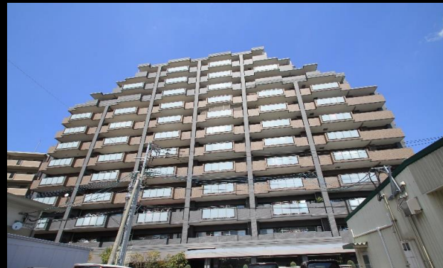
上質なタイル貼の、とても綺麗な建物です