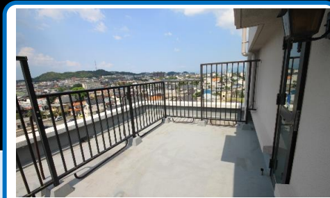
最上階！ルーフバルコニー