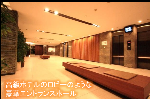
高級ホテルのロビーのような 豪華エントランスホール